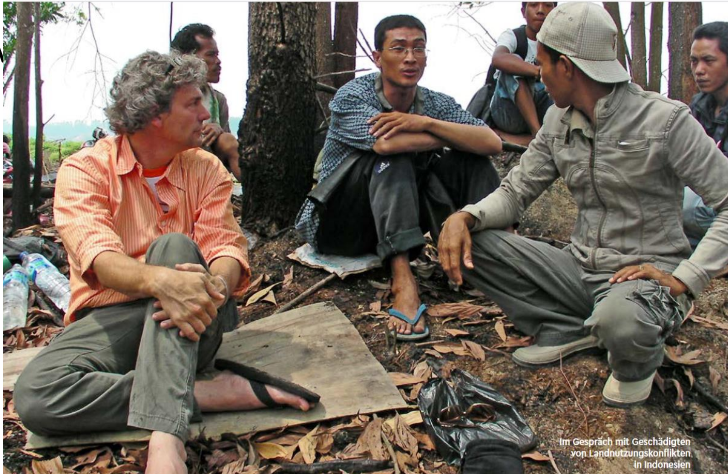
Aus: SÜDWIND: Nachhaltiger Kautschuk: Mehr Wirkung erzielen