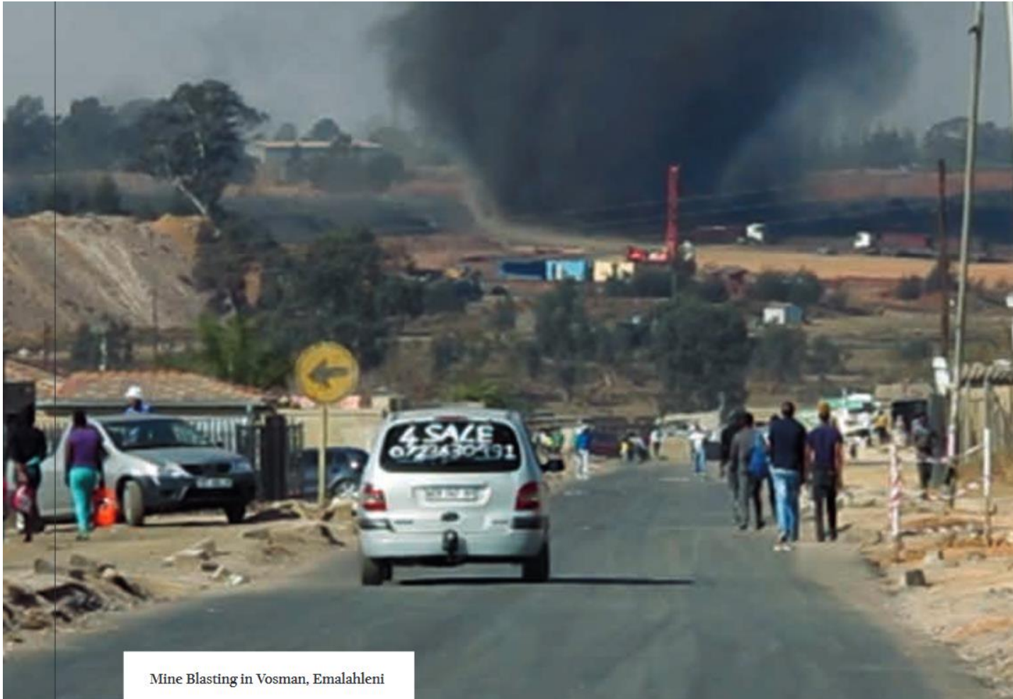
Mine Blasting in Vosman, Emalahleni